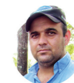
por ALYSSON PAULLINELI Médico veterinário

Cooperado o ideal é que como produtores de leite que somos devemos nos programar para o período seco e de transição para que não tenhamos o leite de nossas vacas sendo descartado pela indústria por falta de qualidade. Qualquer dúvida procure os profissionais do Departamento de Apoio ao Cooperado na Matriz ou em uma filial mais perto de você.