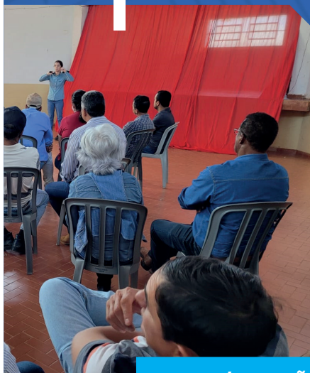
EDEIA / VARJÃO