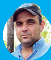
por ALYSSON PAULLINELI Médico veterinário

Enquanto nós produtores não enxergarmos a propriedade como uma empresa que ao final do mês ou do ano tem que apresentar lucros estaremos fadados ao fracasso.