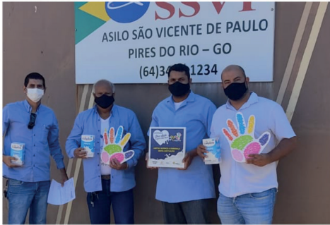
PIRES DO RIO