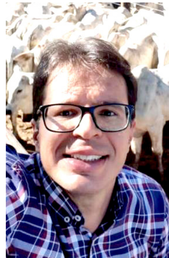
Por Marcelo Barbosa Zootecnista - RT Complem Nutrição Animal

necessidades de produção leiteira ou de engorda do gado de corte, tendo assim, os melhores resultados financeiros e de saúde ruminal para os animais.