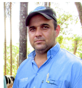
Por Alysson Paullineli médico veterinário